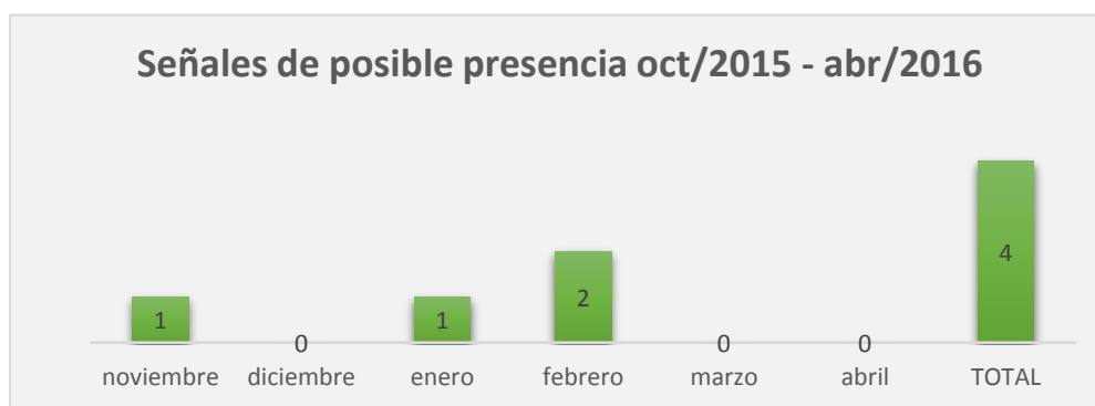
Figura N° 1: Número de señales de posible presencia registradas.

Elaborado por: DIRECCIÓN DE PROTECCIÓN DE PUEBLOS INDÍGENAS EN AISLAMIENTO VOLUNTARIO.