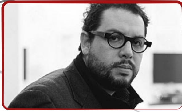
Miguel Robles - Durán.

Geógrafo y teórico social marxista. Su obra es un referente mundial en la crítica a la expresión espacial del modelo capitalista. Autor de numerosos artículos y libros de gran influencia en el desarrollo de la geografía moderna. Co - Fundador del Centro Nacional de Estrategia para el Derecho al Territorio. Profesor Honorario de la Universidad Central del Ecuador.